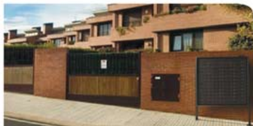
BCP-48G con soporte en ARENA VOLCÁNICA.