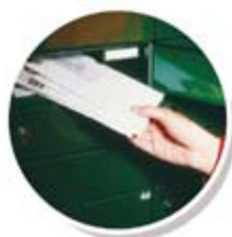
Reparto de correo con portón abierto.